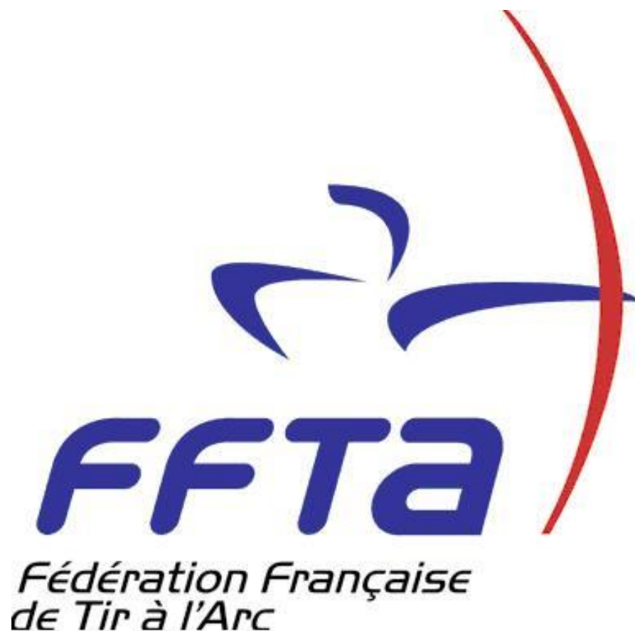
Schéma des formations fédérales